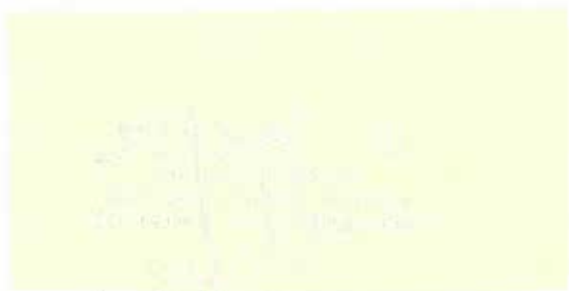
zhotoviteľ Michal Molnár konateľ spoločnosti